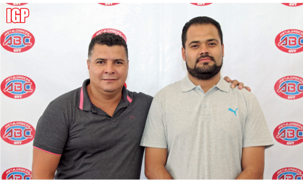
Da Lua e Traquinas